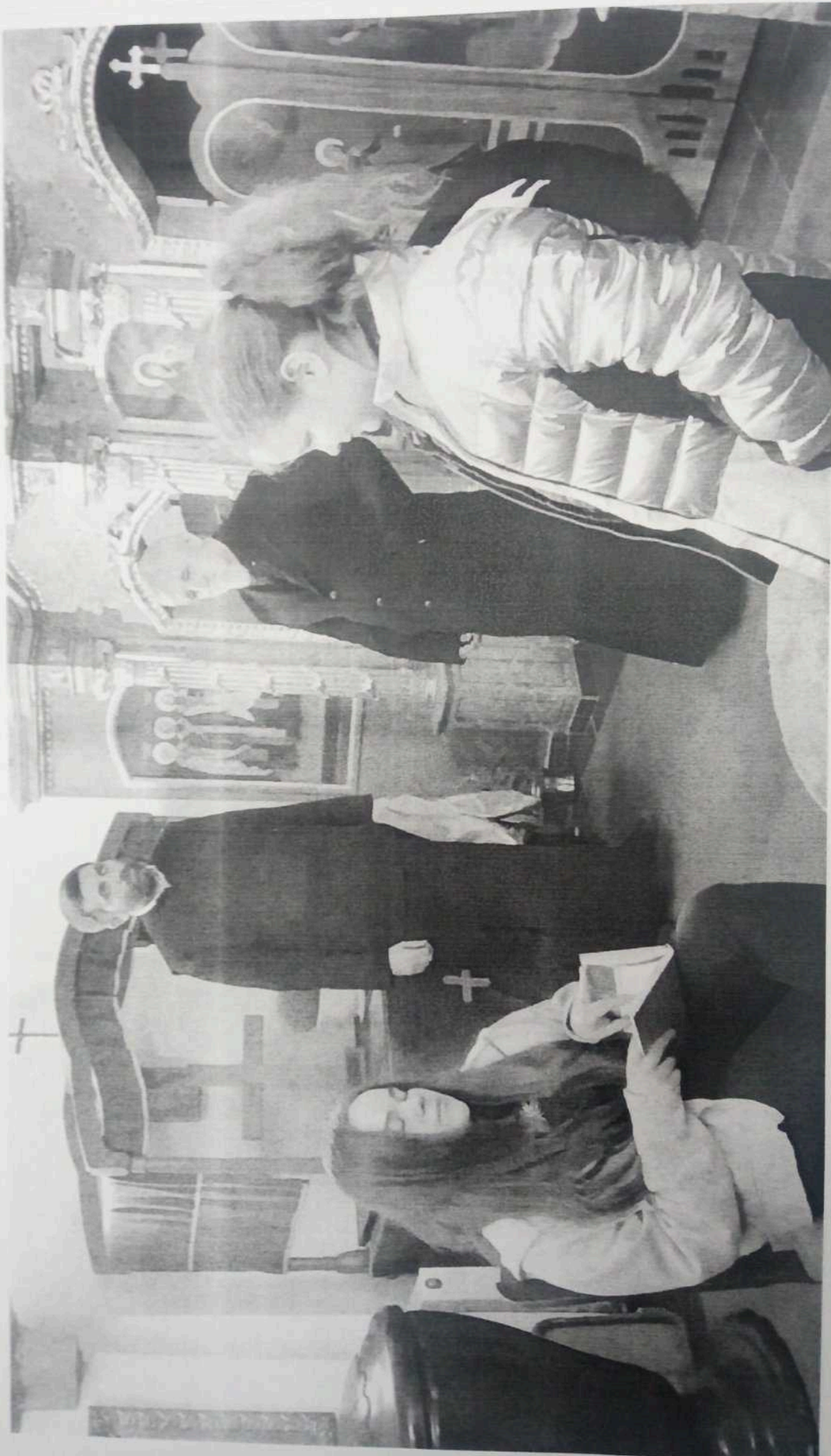
Svatý salvor 27. 1. 2024